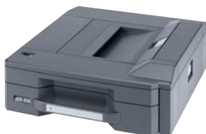
PF-780 Papiercassette voor speciale soorten media. Kan worden gecombineerd met PF-730 en PF-740. Alleen geschikt voor de TASKalfa 4551ci/5551ci.