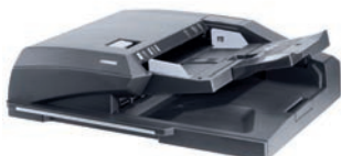
DP-772 DOCUMENTTOEVOER Documenttoevoer in één richting die dubbelzijdige documenten automatisch omkeert.

U hebt keuze uit een eindeloze reeks papierverwerkingsopties. Uw standaardmultifunctional kan worden uitgebreid met twee typen documenttoevoer en twee finishers, waarvan één met een optionele boekjesfunctie. Extra papierladen kunnen de capaciteit van uw machine verhogen tot wel 7.650 vel, zodat u urenlang ononderbroken kunt afdrukken in acht verschillende papierformaten.