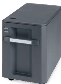
PF-770 A4 SIDE DECK Ideaal voor grote printprocessen op A4 formaat.