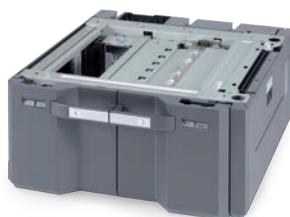
PF-740(B) PAPIERCASSETTE VOOR 4.000 VEL Ondersteunt de formaten A4, B5 en Letter.